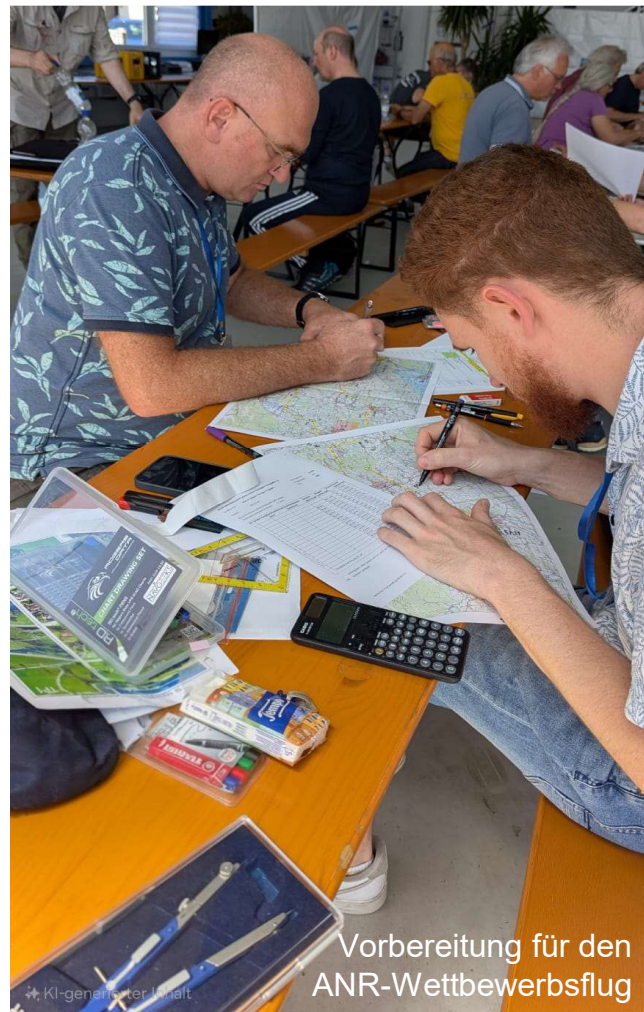
Vorbereitung für den ANR-Wettbewerbsflug

Nasser Flugtag bei den Hochwaldschwalben Gewünscht hatten sich die Modellflieger* vom MFC Hochwaldschwalbe Wetter wie beim Wasserflug-Treffen im Frühjahr 2025. Am Samstag konnten die zahlreichen Teilnehmer* hervorragend trainieren. Am Sonntag (6.7.) hat aber der Wettergott nicht mitgespielt und ließ es regnen. So freuen sich denn schon alle auf den Flugtag im nächsten Jahr - hoffentlich dann bei gutem Wetter.