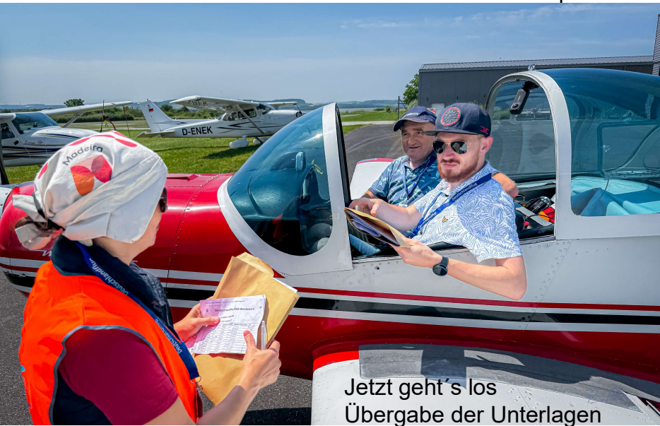
Jetzt geht's los Übergabe der Unterlagen

Platzierungen im Mittelfeld und in der Juniorenwertung freuten sich beide sehr. Nachwuchs gab es bei den Flugzeugen. Neben der RF5 ist nun auch eine Bölkow 209 „Monsun“ im Einsatz.