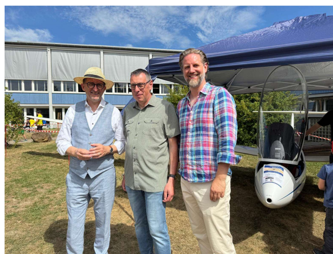
Alte und neue Bekannte (v.l.n.r.)

Ein großes Dankeschön an die viele Helfer*, ohne die eine so prächtige Präsentation nicht möglich wäre